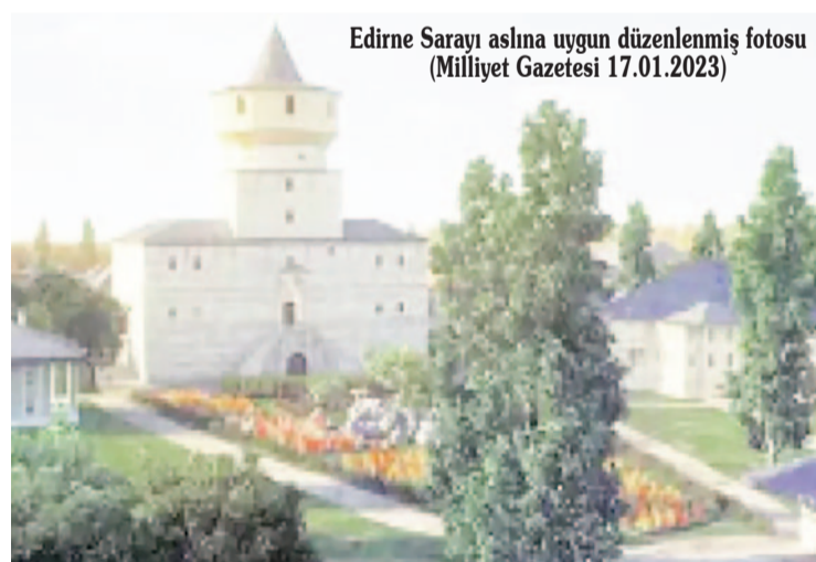
Edirne Sarayı aslına uygun düzenlenmiş fotosu