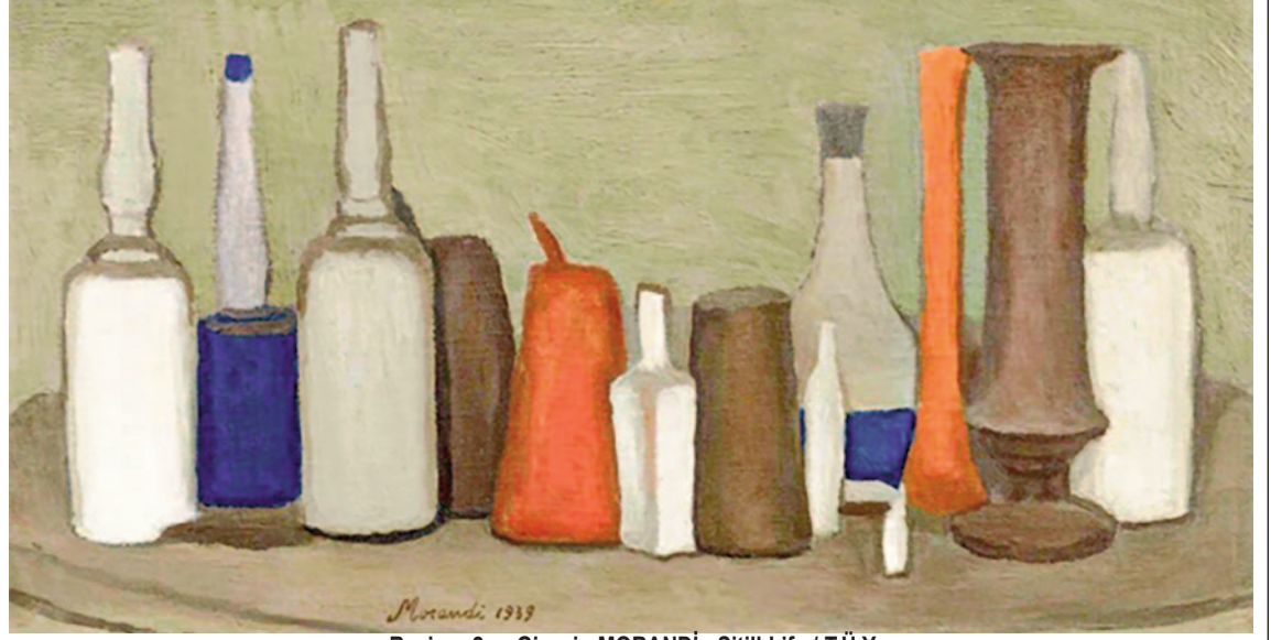
Resim - 2 Giorgio MORANDİ. Sittill Life