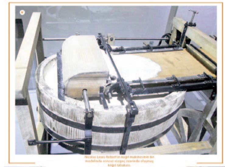
Henri Louis Robert'in kâğıt makinesinin bir modeline göre çizilip üretilen kâğıt tabakası.

kenevir ve pamuk liflerinin veya bunlardan yapılmış paçavraların önce ıslak olarak mayalanmaya bırakılıp ardından kül suyu veya kireç suyu gibi bir