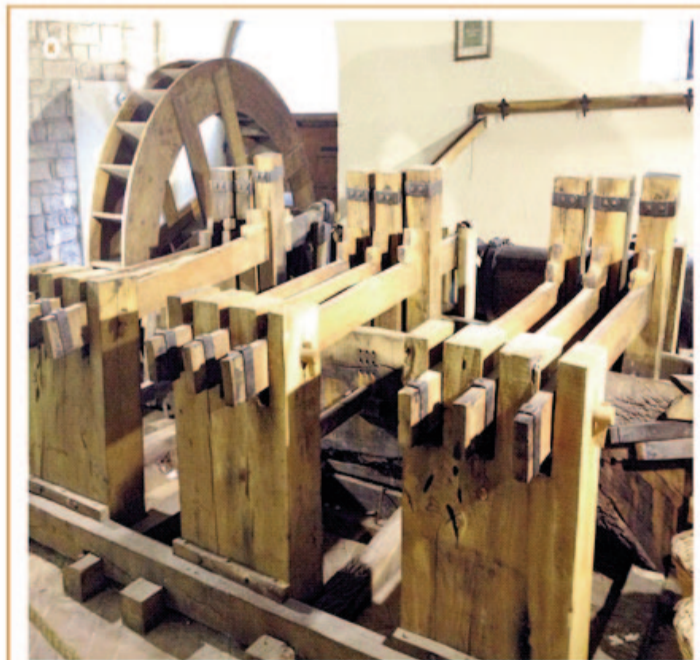
Avrupa'da 1200'de ilk kâğıthanenin kurulduğu İtalyan Fabbrica perindaki Museo della Carta e della Fibra (Kâğıt ve İplik Müzesi). Sağda bir çarkın dibekleri.

Avrupa'da üretilen kâğıdın çok büyük bir bölümü baskı için kullanıldığından yüzeyin emiciliği fazla bir önem taşımamakla birlikte, yazma kitapların yaygın olduğu Doğuda kâğıdın yüzeyinin emici olmaması hem kâğıt kalemin kolayca hareket ederek kayması hem de yanlış yazılan harf veya sözcüklerin silinerek düzeltilmesi açısından büyük önem taşımaktadır. Bu amaçla kâğıt yüzeyine uygulanan işleme "aharlama" ve ardından yapılan parlatmaya da "mühreleme" adı verilir.