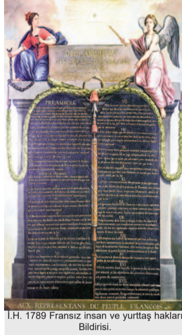
I.H. 1789 Fransız insan ve yurttaş hakları Bildirisi.

İnsan Hakları ile ilgili bildirimlerden söz ederken bunlardan akla ilk geleni ve en ünlü olanı, 1789 tarihli Fransız, 'In-