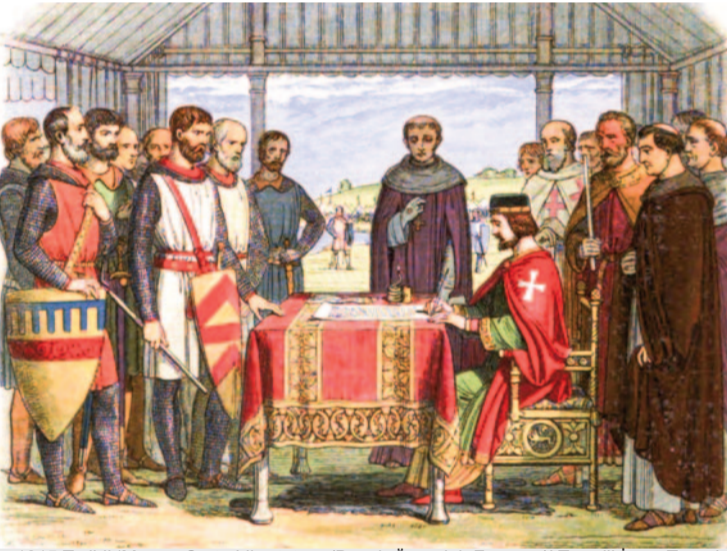
1215 Tarihli 'Magna Carta Libertatum (Büyük Özgürlük Fermanı)' Temsili İmza Töreni.

İngilizler, daha 13. yüzyılın başlarında (1215) o zamanki kralları Yurttaş John'a zorla kabul ettirdikleri 'Magna Carta Libertatum (Büyük Özgürlük Fermanı)' ile kişi haklarının gerçekleşmesi yolunda ilk büyük adımı atmışlardır. Da-