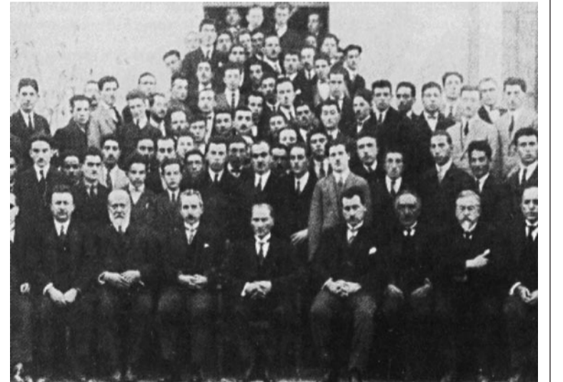
I.H. T.C. İlk Anayasası Olan 1921 Anayasasını Hazırlayan TBMM İlk Üyeleri Toplu Halde.

1982 Anayasası için ise, bu alanlarla ilgili olarak olumlu şeyler ifade etmek oldukça zordur. 1982 Anayasası demokratik liberal anayasa teorisi anlamındaki özgürlük garantilerinin bir belgesi olmak yerine, insan hakları sınırlama ve ihlallerine meşruluk kaynağı kimliğine bürünmüştür. 1982 Anayasası, bu tercih