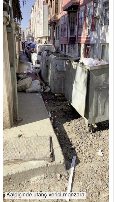
Kaleiçinde utanç verici manzara

önlemek için diğer kurum ve kuruluşlarla işbirliği yapılması.