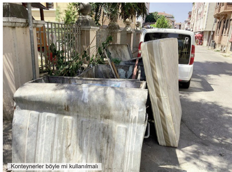
Konteynerler böyle mi kullanılmalı

• "Müslümanlık temizdir, kirsizdir. Siz de temiz olun, te-