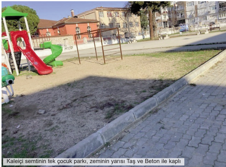
Kaleiçi semtinin tek çocuk parkı, zeminin yarısı Taş ve Beton ile kaplı

neden vazgeçilmez olduğunu kısa ama etkili ifadelerle anlatır.