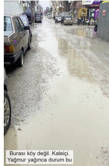
Burası köy değil. Kaleiçi. Yağmur yağınca durum bu

Bu çalışmalar, Belediyelerin Temizlik İşleri Müdürlükleri tarafından organize edilir ve ge-