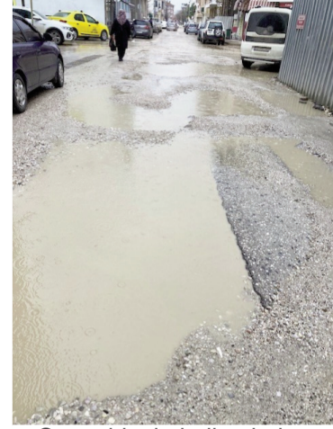
Şu caddenin haline bakın

Şehrimizde iki ay kadar önce başlatılan yeni yer altı su borularının döşenmesi işi ise halka "gına" getirdi! Bakalım daha ne kadar devam edecek! Önce bu işe yanlış mevsimde başlanıldı! İlk düğme yanlış iliklenirse son düğmeye kadar hepsi yanlış olur! Uzmanlar bu işlerin Haziran - Eylül ayların-