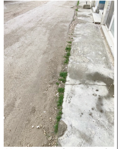
Yaya kaldırımı Cadde ile sıfır noktada