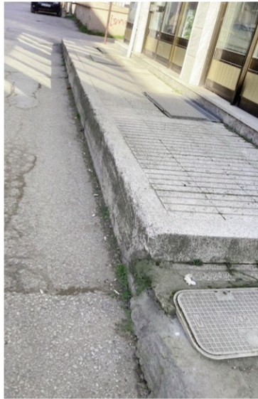
Dünya standartlarından 2 misli yüksek yaya kaldırımı

Edirne'de "güya bir şeyler yapılıyor" gibi gösterilmeye çalışılsa da günün şartlarına uygun ve olması gereken pek bir şey yapıldığı söylenemez! (Belediye hizmetleri bakımından).