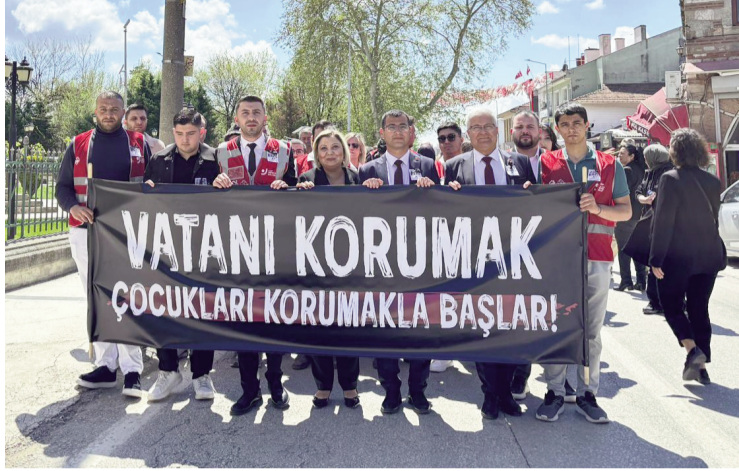
Edirne'de CHP örgütü, 23 Nisan Ulusal Egemenlik ve Çocuk Bayramı'nda, Şanlıurfa ve Kahramanmaraş'taki okullarda gerçekleşen silahlı saldırıları sessiz yürüyüşle kınadı.