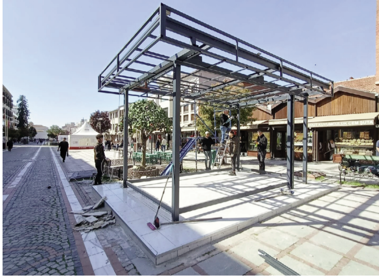
Edirne'de Saraçlar Caddesi Sokak Sağlıklaştırma Projesi kapsamında kurulan ve yapıldığı dönemde estetiği bozduğu

yönüne tartışmalara yol açan 'İrtibat Bürosu' (Tanıtım Ofisi), caddeden kaldırıldı.