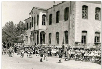
Resim.1 Yıkılan tarihi bina, Kurtuluş İlkokulu