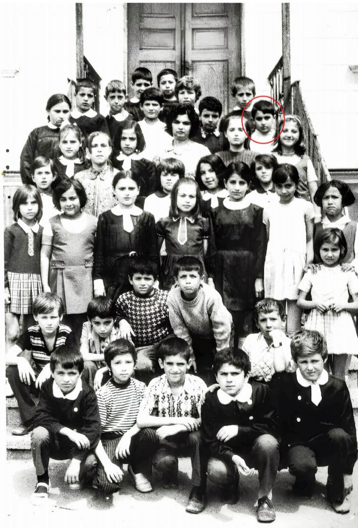
Resim.5 Edirne İstiklâl İlkokulu 1971-72 Öğretim Yılı 4-B sınıfı

Çocukluğuma dair hiç unutamadığım başka bir ayrıntı daha var. Annemiz babamızı bizi sokağa gönderdiğinde, bazen sabahtan akşama kadar eve dönmezdik. Buna rağmen ailelerimiz en küçük bir endişe duymazdı Hani teşbihte hata olmaz derler ya, nasıl koyunları inekleri sabah salarsınız çayı-