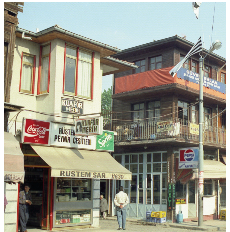
Resim.6 Rüstem Şar'a ait Saraçlar caddesi üzerinde ŞAR ŞARKÜTERİ