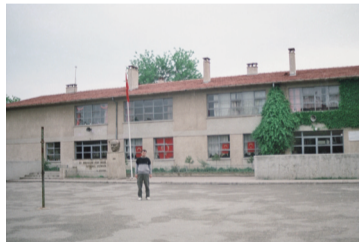
Resim.2 1992 Edirne'ye askeri görevle geldiğim sırada Kurtuluş İlkokulu yeni binası önünde.

meyve ağacı dolu bahçesi, tavuk kümesi ve bu bahçede tüm komşularla birlikte gelsin neşe dolu günler.