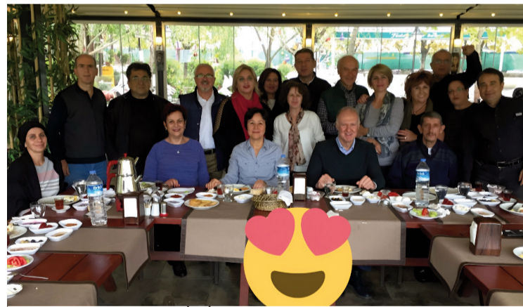
Resim.10 Kadim İSTİKLAL ilkokulu kardeşliğimiz. 12.11.2017

tık bizi beş yıl boyunca bağrına basan Edirne'mizden, o gölgesinde koşturduğumuz Selimiye'den ve edindiğimiz tüm komşulardan, dostlardan, arkadaşlarımızdan ayrılık zamanı başa çatmıştı. Komşularla veda esnası gözyaşlarımız sel oldu. Kız kardeşim ve ben gözyaşları ile ayrıldık bu yuva bildiğimiz şehirden. Ve bir daha da hiç ayrıldığımız şehir için gözyaşı dökmedik zaten. Hatta bu ayrılıkta benim isyanım o kadar büyük oldu ki, gittiğimiz kos-